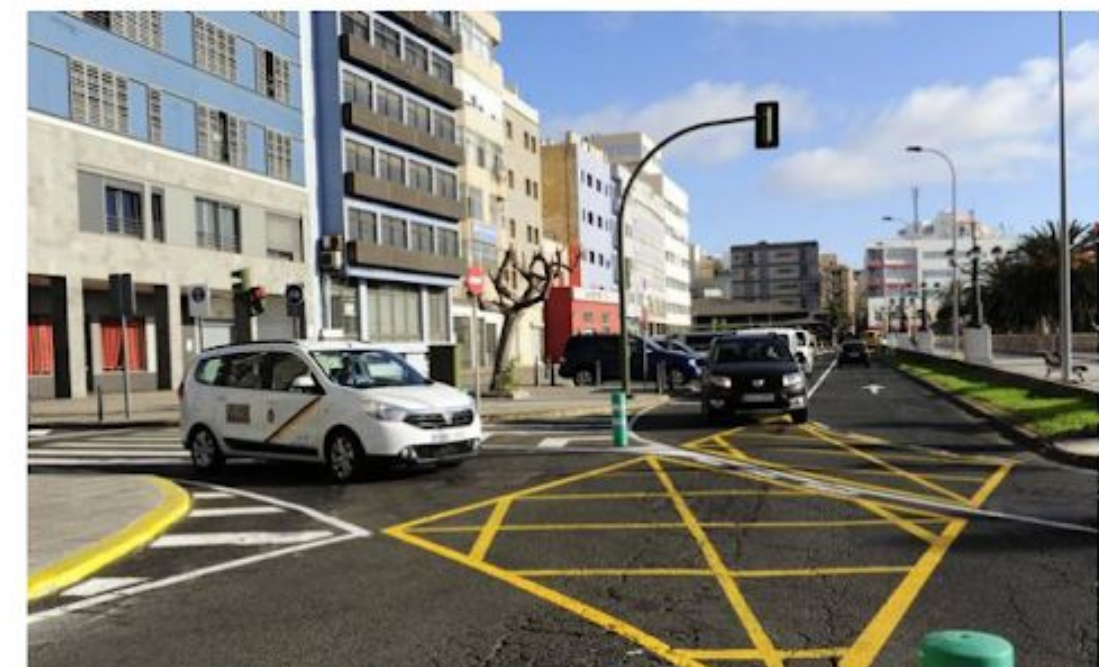
Imagen de archivo de la calle Eduardo Benot.

Dado el estrechamiento de la acera que se produce por la presencia del vallado perimetral del IES La Isleta, la propuesta consiste en utilizar esa franja de 3,5 metros para ampliar la acera, ordenar los aparcamientos del IES La Isleta y aumentar la seguridad de los alumnos/as mejorando los accesos al centro educativo.